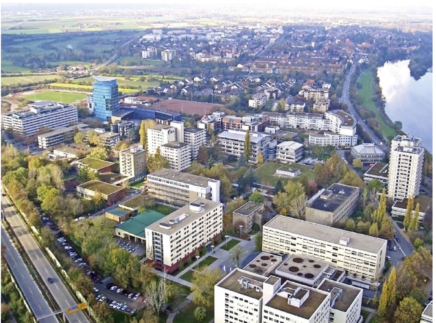
Das Berufsförderungswerk Heidelberg wirkt wie eine Stadt für sich.

Was macht man, wenn man selbst mit Hörgerät seine Umwelt nicht mehr versteht und somit nicht an privaten oder beruflichen Ereignissen teilnehmen kann? Das Thema »Hören und Leben« stand bei dem diesjährigen CI-Symposium im Vordergrund und wurde von Ärzten, Betroffenen, Kostenträgern, Reha-Einrichtungen und Verbänden diskutiert. Im Mittelpunkt stand hierbei das Cochlea-Implantat. Es wurden Erfahrungen ausgetauscht, OP-Verfahren erläutert, Perspektiven der beruflichen Integration vorgestellt sowie Möglichkeiten der Einbindung von Hörakustikern bei der Nachbetreuung diskutiert.